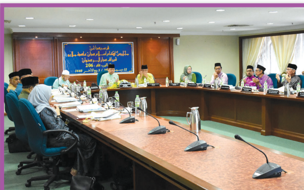
Persidangan MAIPk Kali Ke-206 Pada 11 Disember 2018