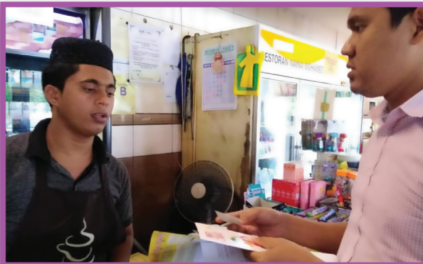
Program Jejak Perniaga Di Pasaraya Mydin, Meru Dan Pekan Razaki, Ipoh Pada 17-18 Oktober 2018