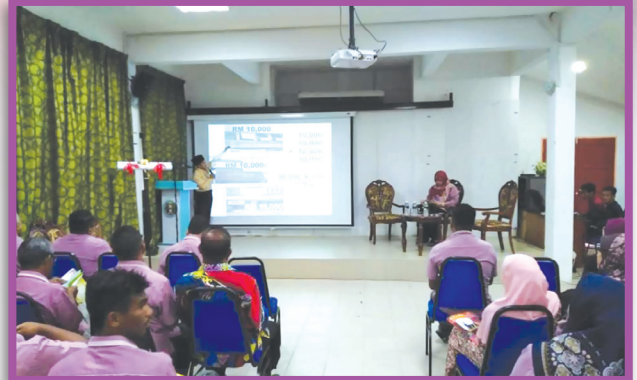
Taklimat Zakat Pendapatan Kepada Pehidmat Majlis Daerah Selama Pada 10 Oktober 2018