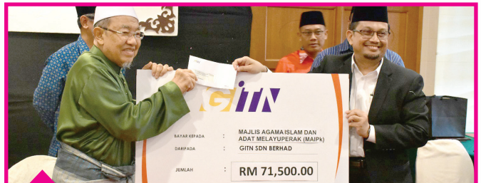
GITN Sdn. Berhad RM71,500.00