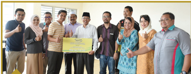
21 NOVEMBER 2018 12 Usahawan Perbadanan Usahawan Nasional Berhad RM56,410