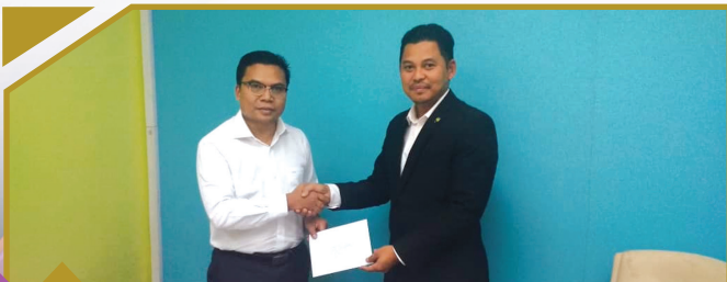
19 DISEMBER 2018 Maybank Islamic Asset Management Sdn. Bhd. RM18,382.35