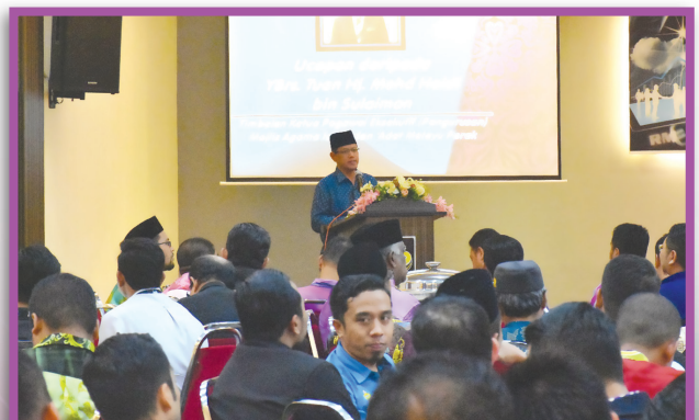
Perhimpunan Bulanan MAIPk Pada 27 Disember 2018