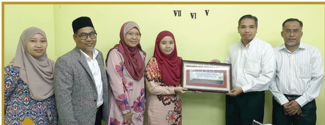
14 DISEMBER 2018 Lembaga Pembangunan Industri Pembinaan Malaysia (CIDB) RM35,463.00