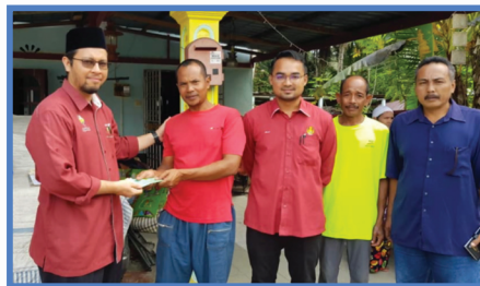
Sumbangan Bantuan Kewangan Kepada Mangsa Kebakaran Rumah Di Kg. Cheh Hilir, Kuala Kangsar Pada 10 Disember 2018