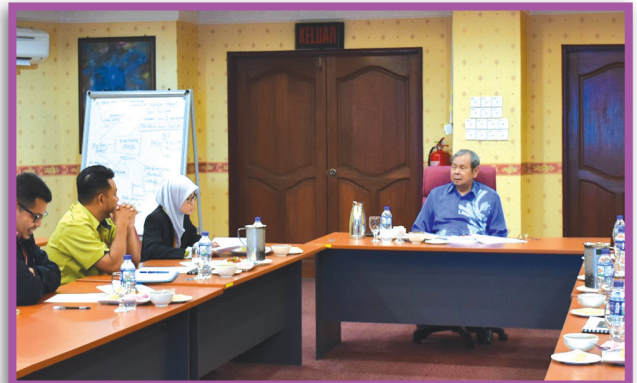
Mesyuarat Pelan Strategik MAIPk 2016-2021 Pada 24 Oktober 2018