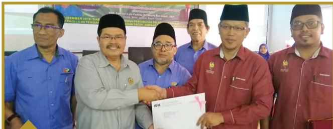
8 DISEMBER 2018 Koperasi Perladangan Kawasan Bagan Datuk RM325,345.35