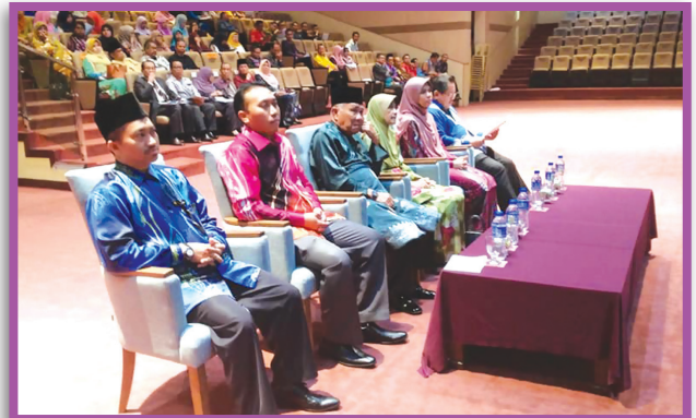
Ceramah Zakat Dan Wakaf Sempena Program Executive Talk "Institusi Kesultanan Perak" Di Auditorium Tun Abdul Razak, Kolej Melayu Kuala Kangsar Pada 29 November 2018