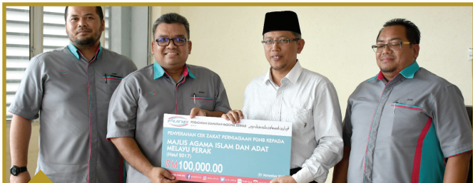
21 NOVEMBER 2018 Perbadanan Usahawan Nasional Berhad RM100,000