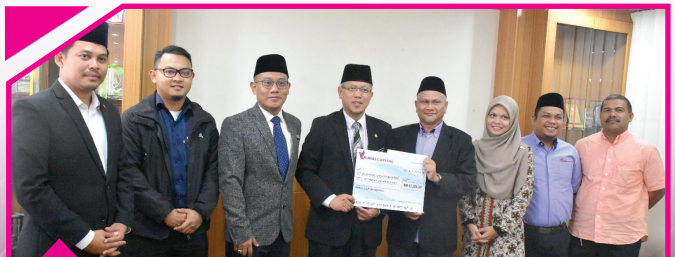
28 DISEMBER 2018 Rural Capital Berhad RM53,008.00