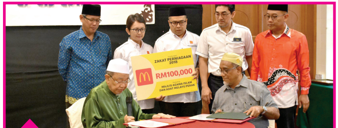
Gerbang Alaf Restaurants Sdn Bhd (McDonald's Malaysia) RM100,000.00