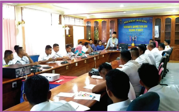
Taklimat Zakat Dan Wakaf Di Stesen Komunikasi TLDM Parit Pada 26 Oktober 2018