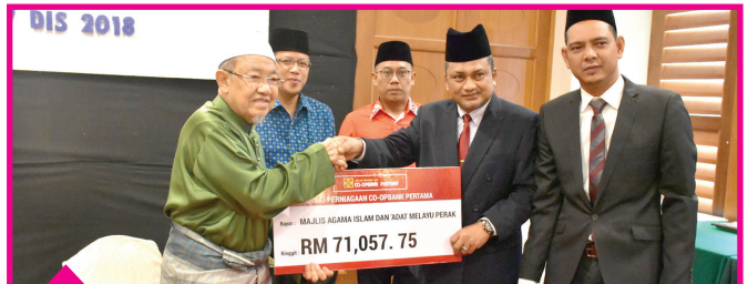
Koperasi Co-Opbank Pertama Malaysia Berhad RM71,057.75