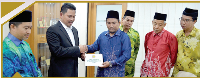
8 OKTOBER 2018 Koperasi Anggota Kerajaan Ipoh Berhad RM78,106.25