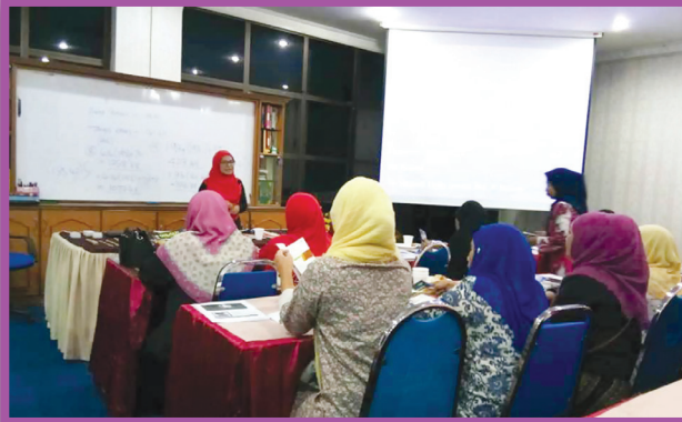
Taklimat Tentang Perhiasan Wanita Dan Kaedah Menentukan Kiraan Zakat Emas Perhiasan Dan Simpanan Di Masjid Negeri Perak Pada 1 Oktober 2018