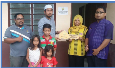
Bantuan Bina Rumah Kepada Keluarga Muallaf Di Perkampungan Orang Asli Chinggong. Muallim Pada 9 November 2018