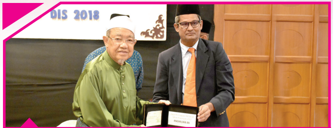
27 DISEMBER 2018 Telekom Malaysia Berhad RM249,008.00